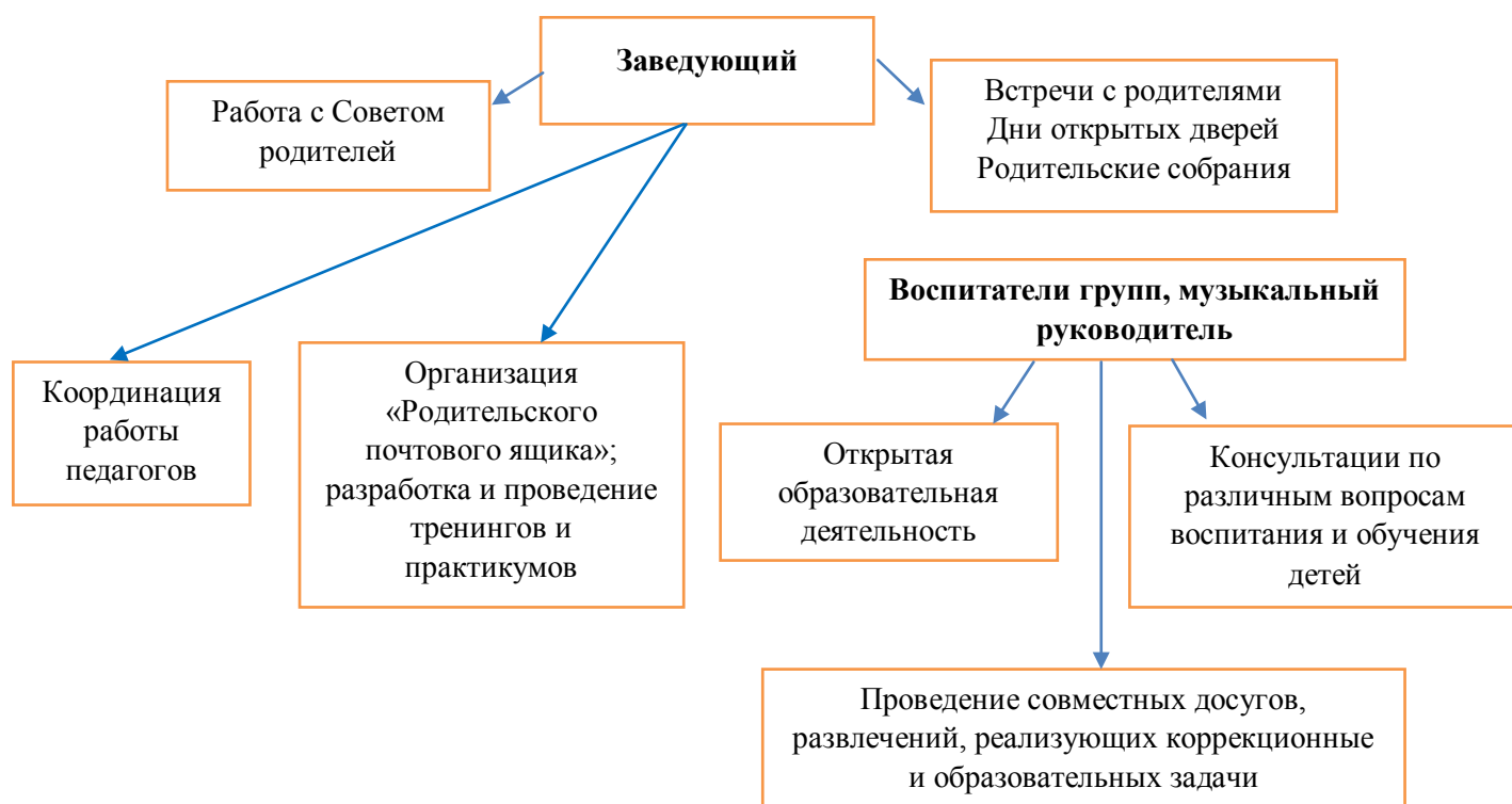
Схема взаимодействия с семьями воспитанников